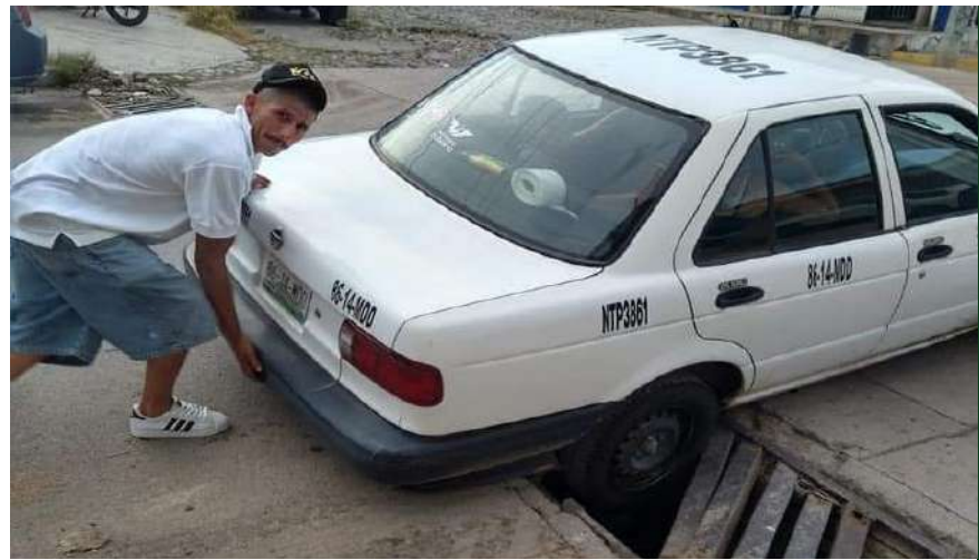
• Las pésimas condiciones de las rejillas del drenaje pluvial causan estos accidentes. ¿Quién debe pagar los daños a los vehículos?

• Estos trabajadores nunca terminarán el bacheo en esta devastada ciudad