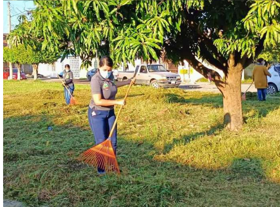
Trabajadores del SIAPA realizando su trabajo, que no cualquier persona sabe hacer, siempre con la idea de dar el mejor servicio al pueblo.