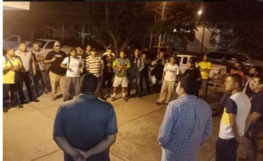
Reunión de trabajo de integrantes del Comité con los trabajadores de Aseo Público.