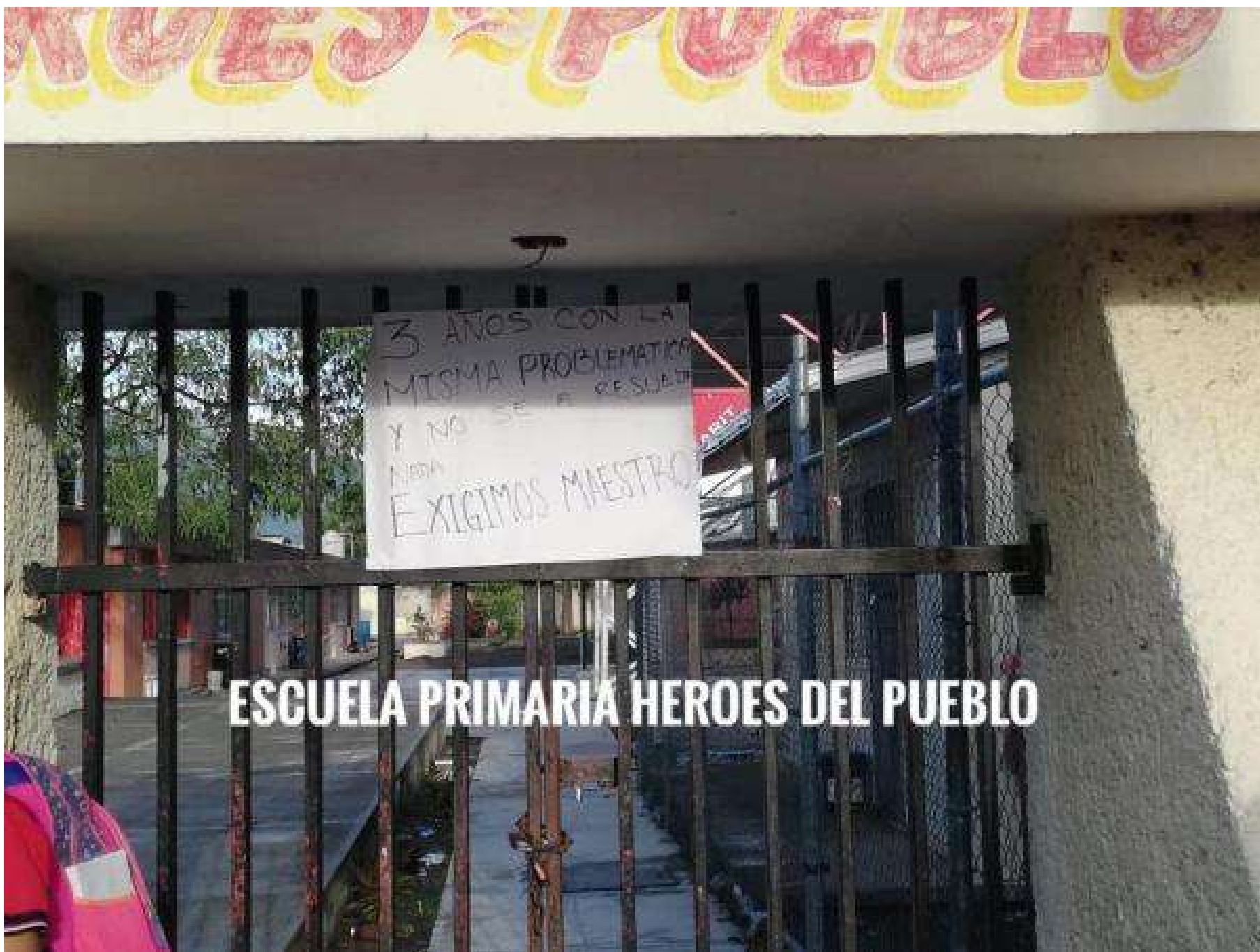
ESCUELA PRIMARIA HEROES DEL PUEBLO

Finalmente, los quejosos hacen un llamado a la autoridad escolar para que entregue las plazas vacantes a quienes tienen derecho y los alumnos puedan continuar su enseñanza sin ningún pretexto ya sea de forma presencial o en línea.