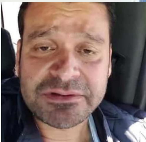
ANTONIO ECHEVARRÍA GARCÍA GOBERNADOR DE NAYARIT

Cabe destacar que los comisionados asumieron el cargo hace apenas unas semanas y de inmediato comenzaron a trabajar en las 2 denuncias ya interpuestas más otras dos que se interpondrán en los próximos días.