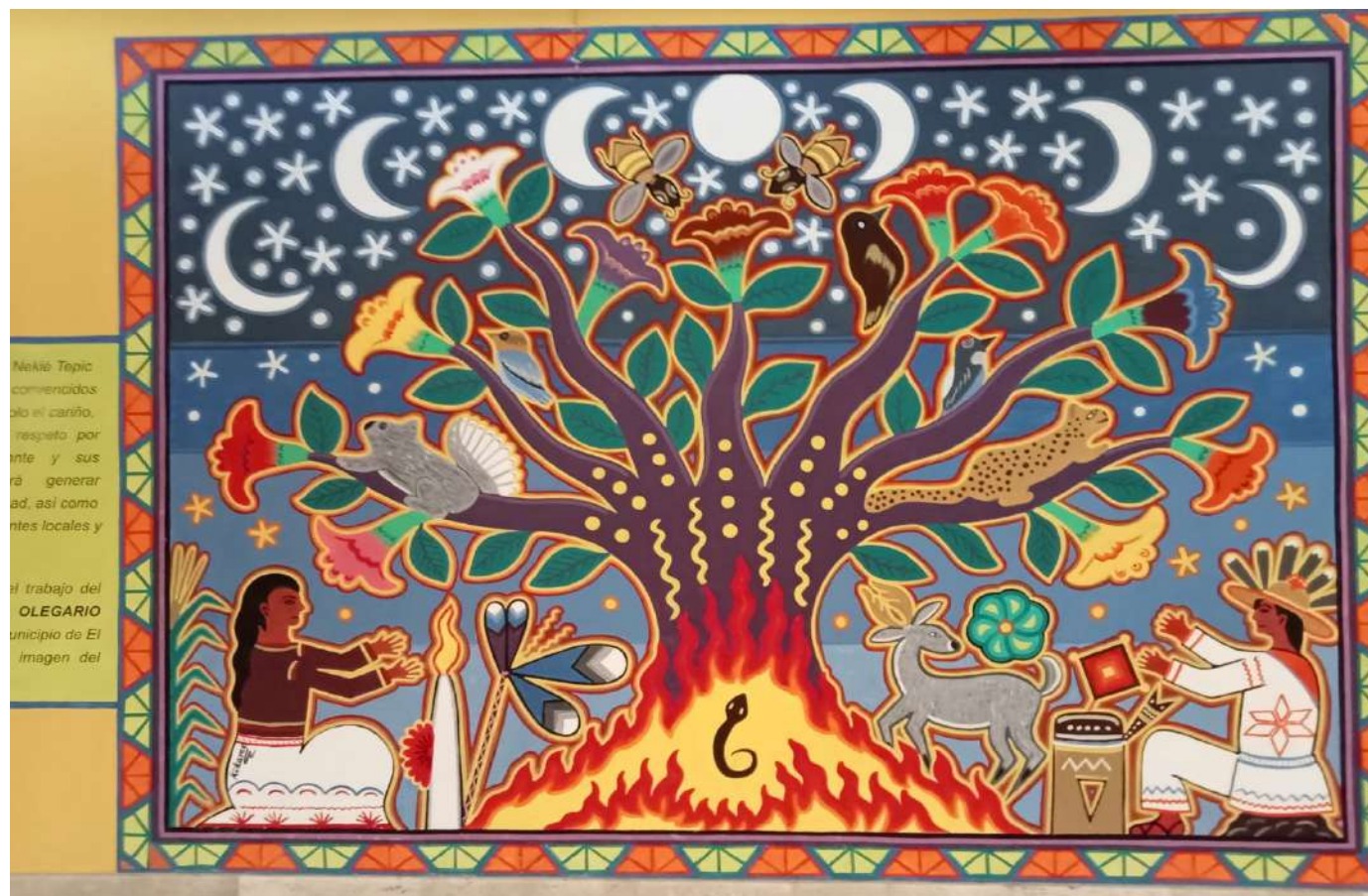
Neklé Tepic comencidos do el cariño. respeto por nte y sus ra generar ad, así como ntes locales y