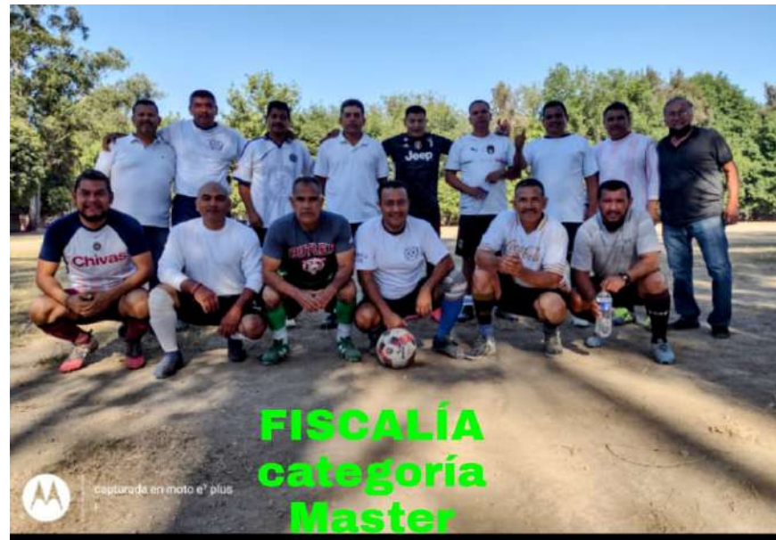
FISCALÍA categoría Master