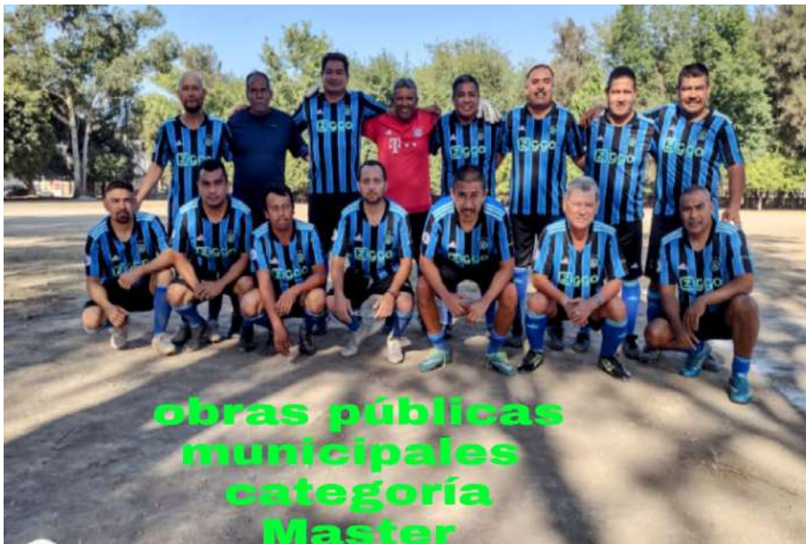
obras públicas municipales categoría Master