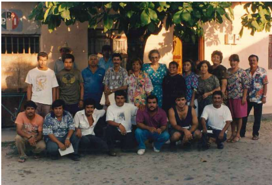
Tiempos aquellos con los SUTSEMistas de la Sección de Villa Hidalgo.