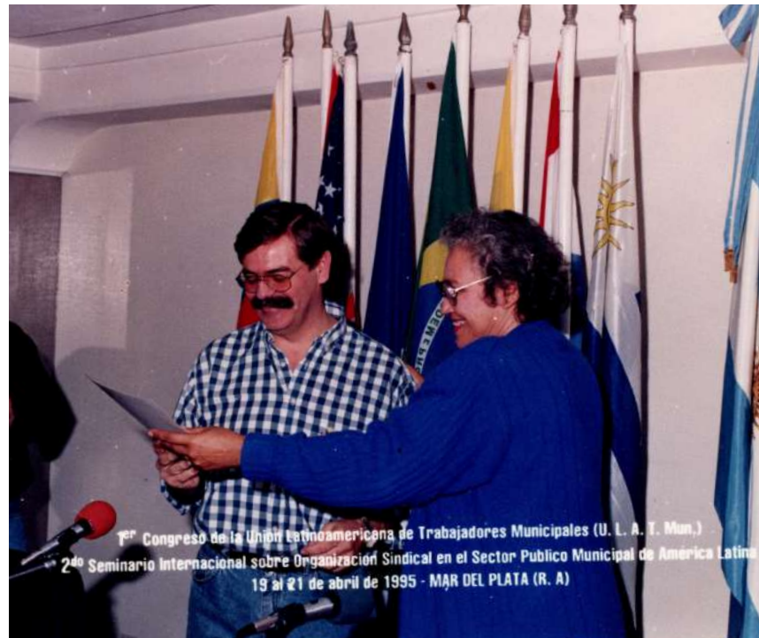
1º Congreso de la Unión Latinoamericana de Trabajadores Municipales (U. L. A. T. Mun.) 2º Seminario Internacional sobre Organización Sindical en el Sector Público Municipal de América Latina 19 al 21 de abril de 1995 - MAR DEL PLATA (R. A)