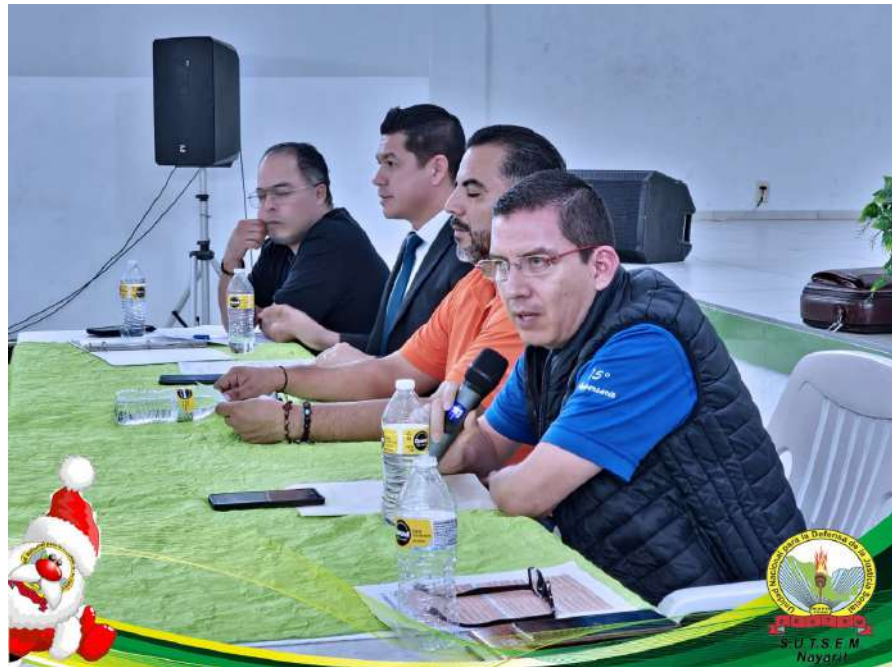
Reunión de trabajo de algunos integrantes del comité del SUTSEM con los directivos del Siapa-Tepic para gestionar asuntos laborales.