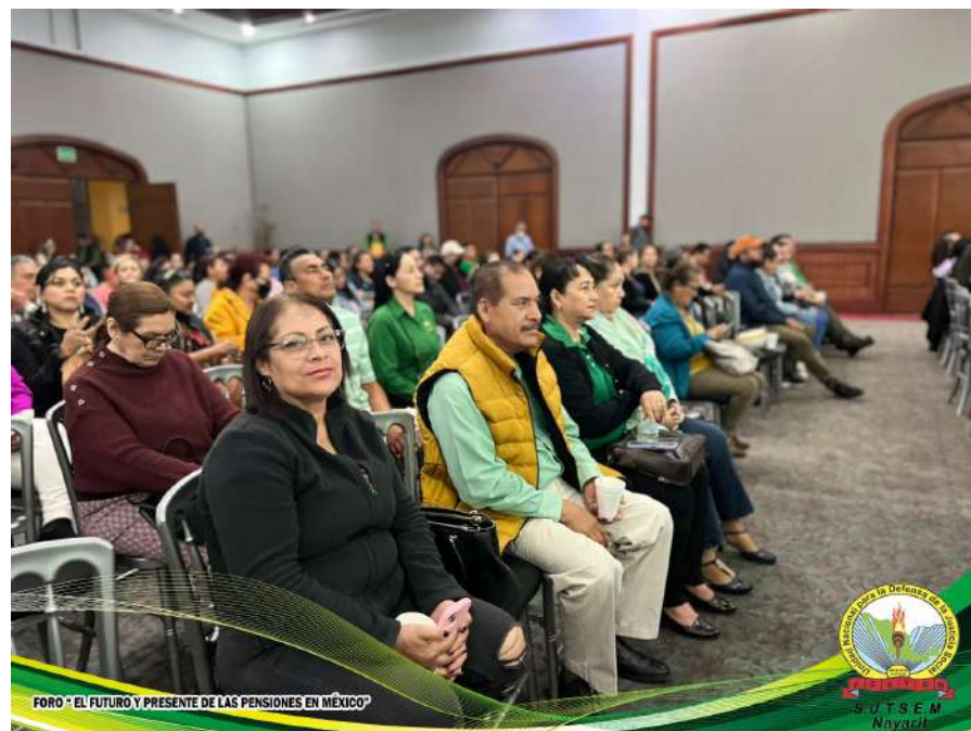
FORO "EL FUTURO Y PRESENTE DE LAS PENSIONES EN MÉXICO"