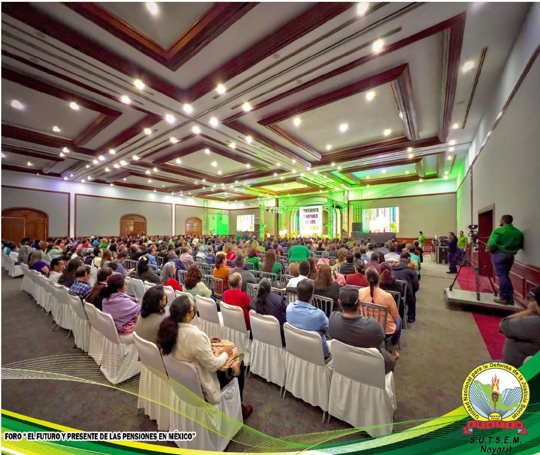
FORO "EL FUTURO Y PRESENTE DE LAS PENSIONES EN MÉXICO"