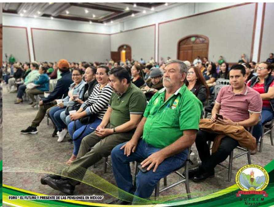
FORO "EL FUTURO Y PRESENTE DE LAS PENSIONES EN MÉXICO"