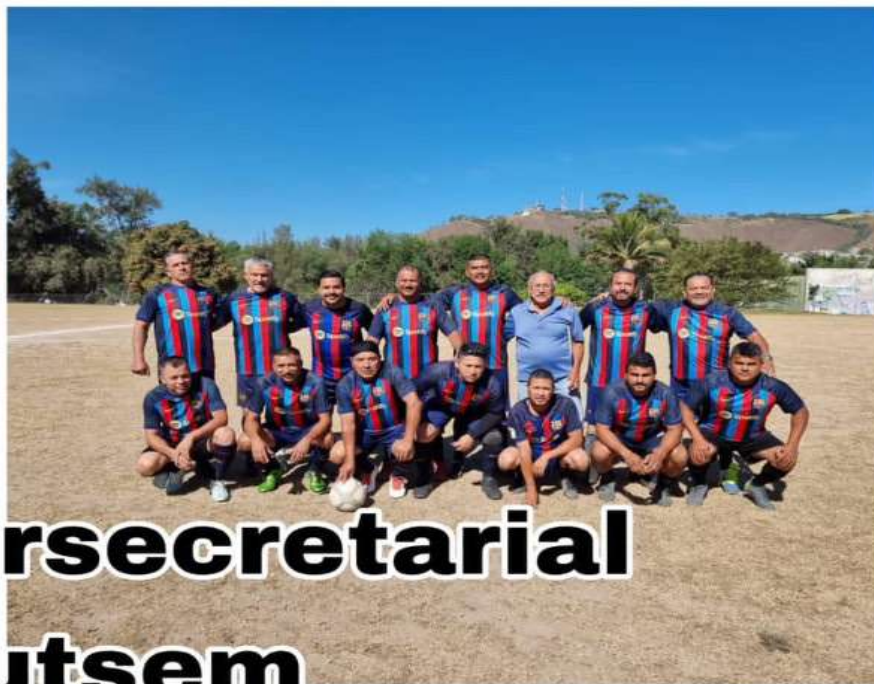
Torneo Intersecretarial del Sutsem