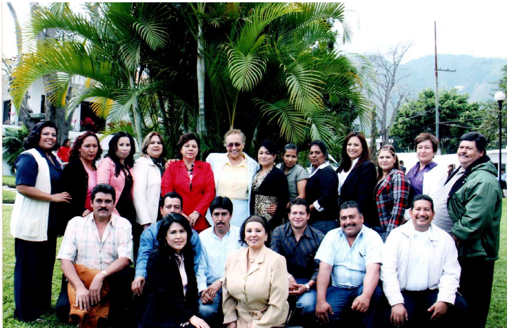
Una de tantas actividades que realizaba el SUTSEM era organizar kermeses en las que los trabajadores vendían sus productos con su beneficio.