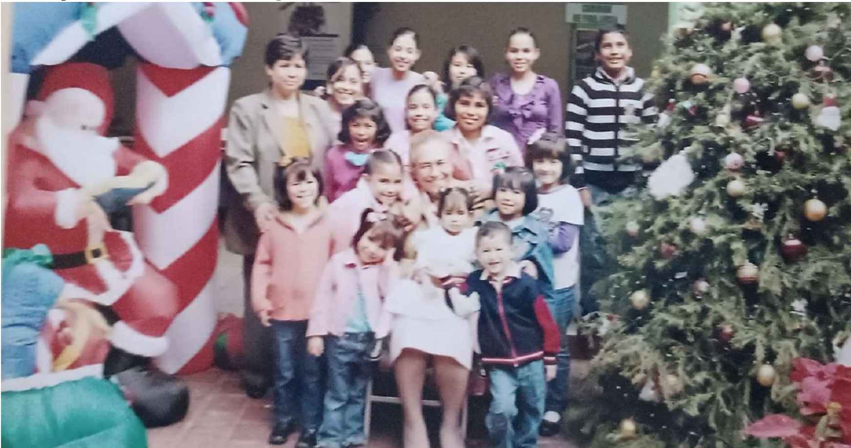
Chicas SUTSEMistas en convivencia.