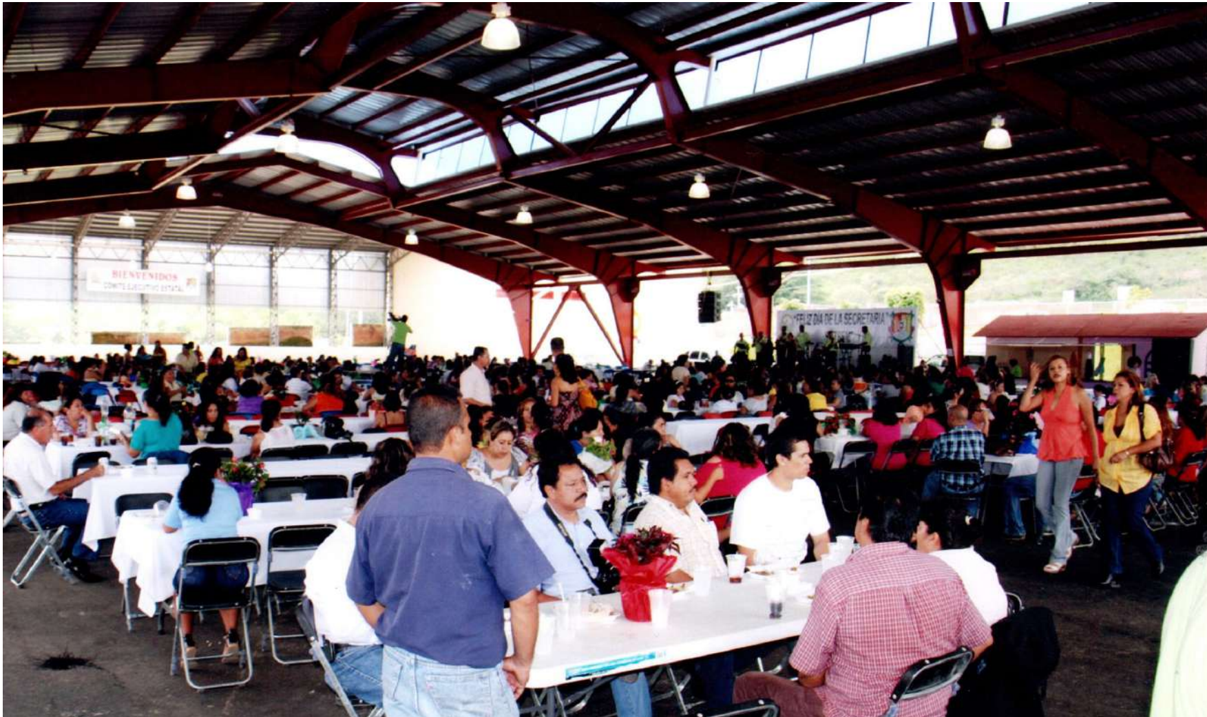
Con ayuda de muchas SUTSEMistas se organizó entre otras muchas cosas, una conferencia con César Lozano que fue mu apapachado por muchas mujeres.