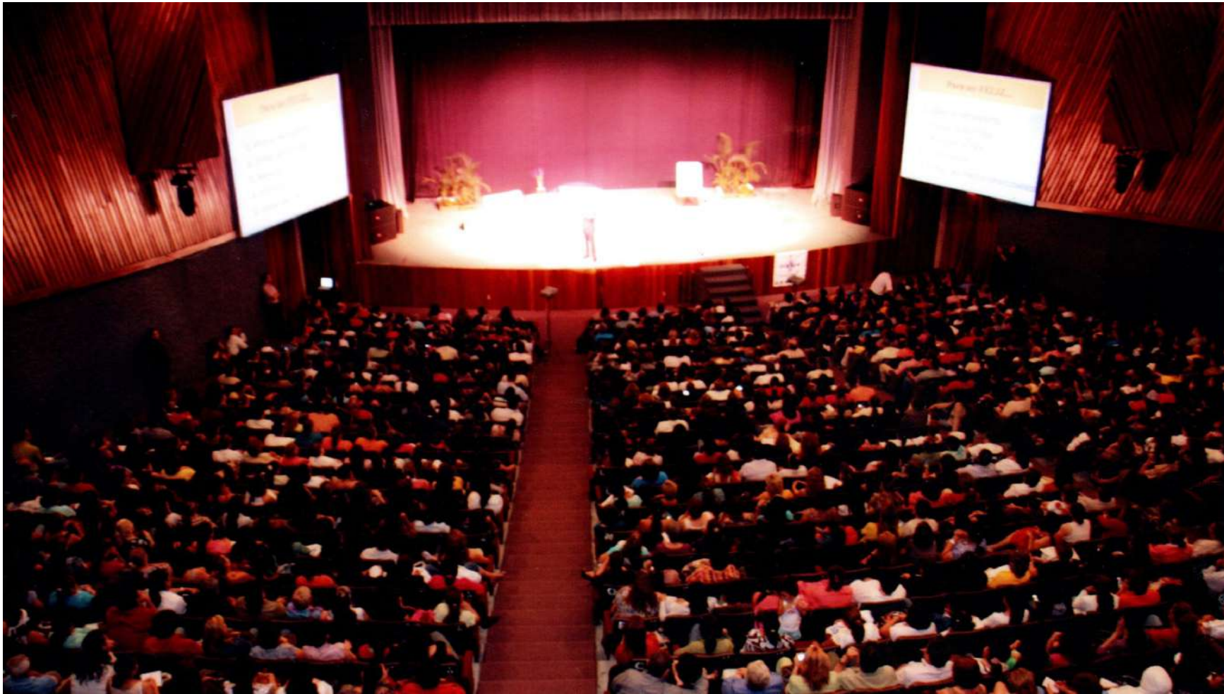
Se llevó de parte del SUTSEM una bonita artesanía huichol.

Lleno total el entonces teatro del pueblo.