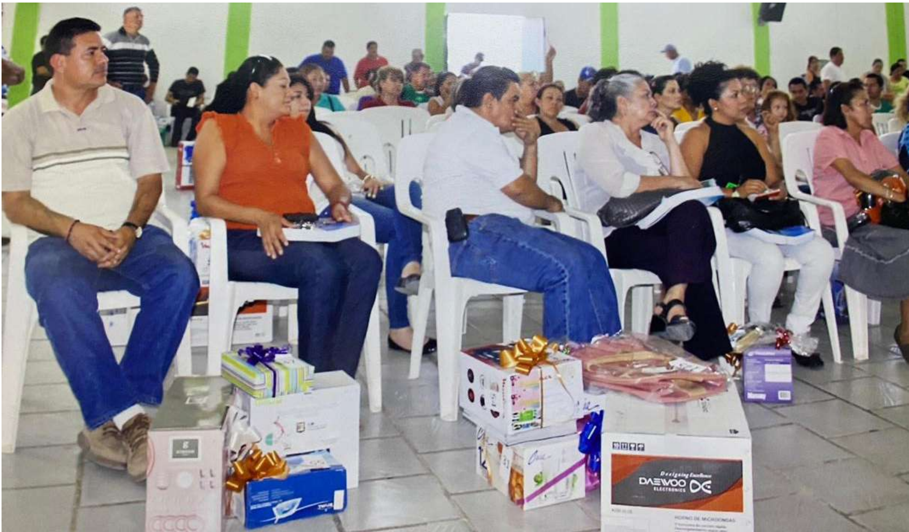
Reunión con los peritos de la fiscalía para platicar la problemática. Siempre han existido las injusticias