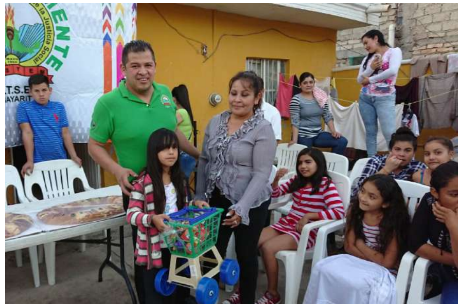
La Secretaría de Acción Juvenil, apoyada por varios integrantes del Comité realizaron el juguetón del SUTSEM en colonias populares, llevando regalos y dulces a los niños.