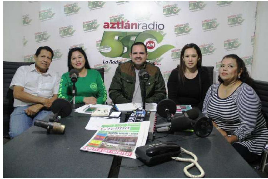
Dirigentes Seccionales de Santiago Ixc., Tuxpan y Xalisco comparecieron en el programa de "SUTSEM, Sindicalismo de Vanguardia" para dar a conocer la forma como trataron a los trabajadores los Ayuntamientos con los pagos de fin de año.