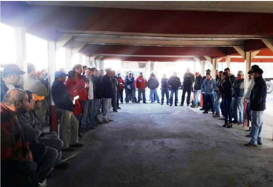
A temprana hora la comisión que a nombre del Comité del SUTSEM acude a la Secretaria de Obras Públicas a invitar a los trabajadores a asistir a las pláticas que el marakame está impartiendo sobre las adicciones.