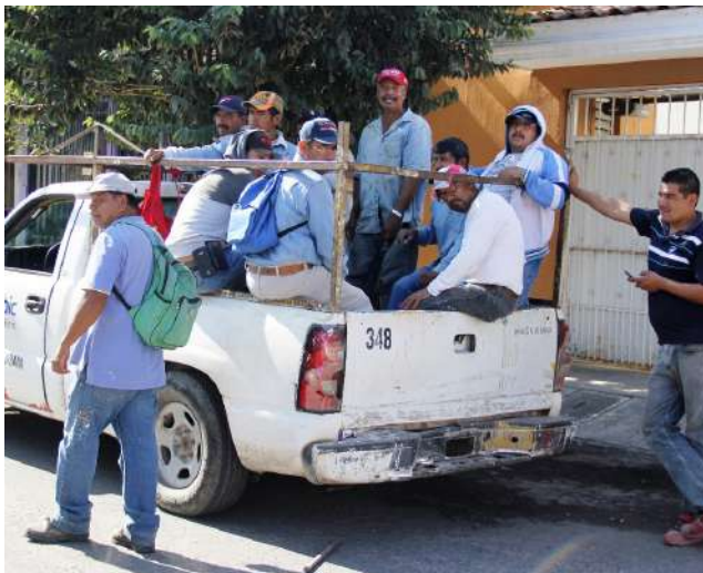
Así trasladan a los trabajadores en las dependencias del Gobierno Estatal o Municipal, amontonados y en vehículos en malas condiciones. La Ley de Transito prohíbe transportar personas en la caja de la pick up.