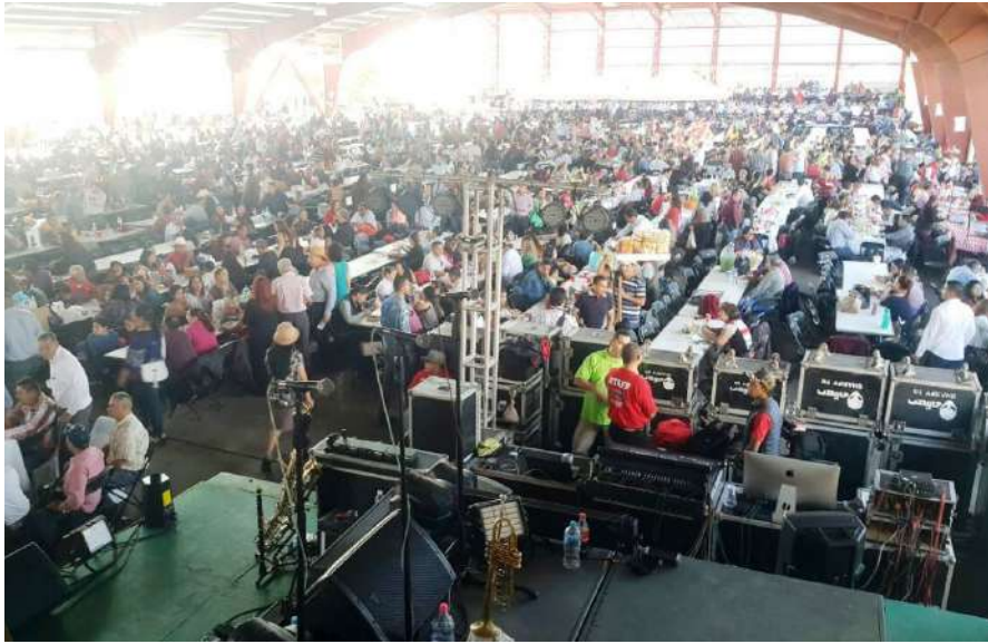
El festejo que realizó la Sección 20 del SNTE con motivo del nuevo año se vio muy concurrido y alegre.