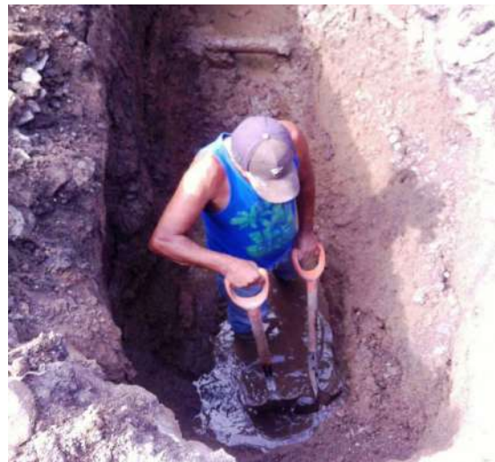
Así trabajan los SUTSEMistas en el SIAPA y sin uniformes ni implementos de seguridad y sin pagos puntuales. Todo el tiempo los trabajadores escuchan la cantaleta de que no hay dinero.