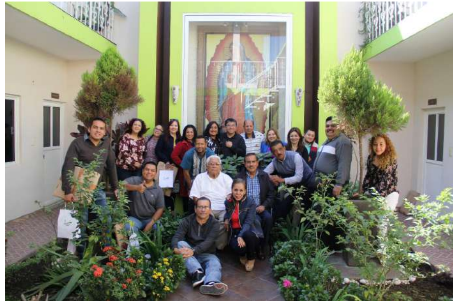
Este es el equipo de lujo que realiza el trabajo para que cada semana llegue la información del único periódico independiente del Estado. Pura calidad, compadre!!