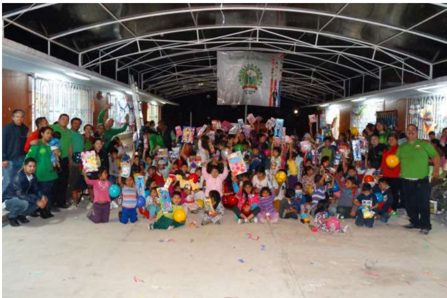
En una de las colonias a las que llegó el programa Juguetón del SUTSEM se vio muy concurrido y alegre el evento.