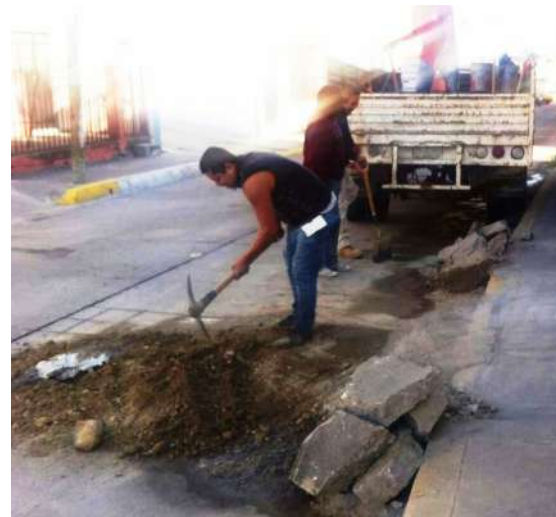
A pico y pala, a la antigüita, los trabajadores del SIAPA rompen el concreto para realizar sus trabajos de reaparición de fugas de agua potable y drenaje. Nomás en Nayarit están tan atrasados.