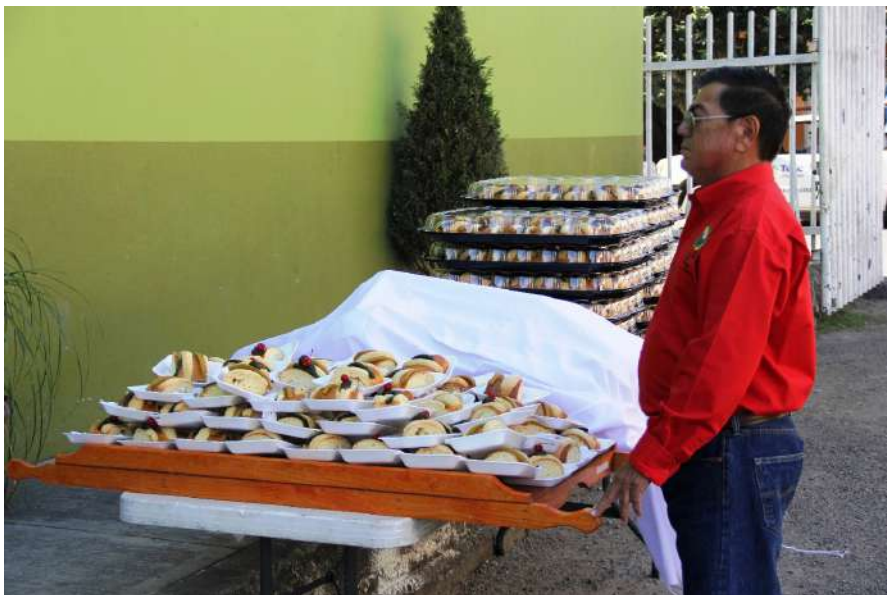
Los jubilados realizaron su primera asamblea ordinaria repartiendo un rico pedazo de pastel.