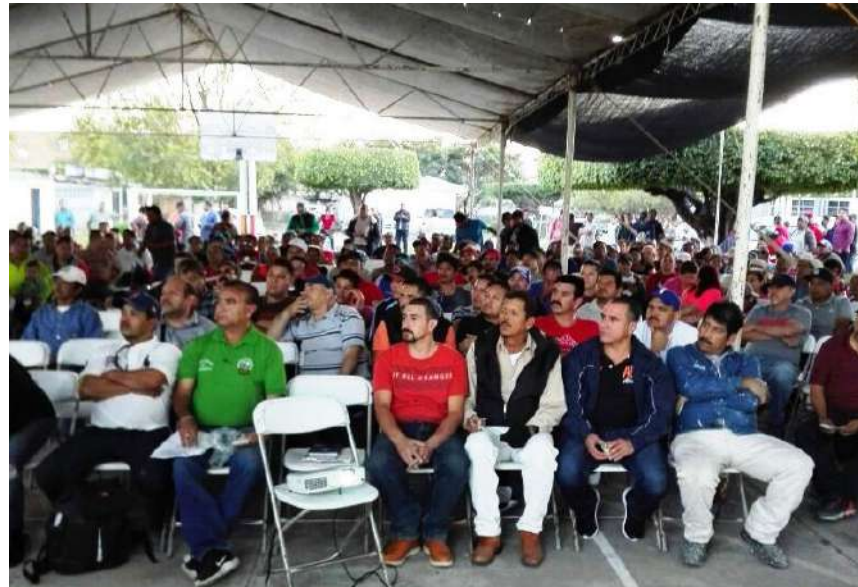
Los trabajadores de la Secretaria de Obras Públicas asistieron a las pláticas que imparte marakame sobre las adicciones.