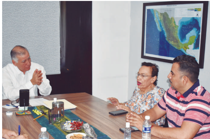
En reunión celebrada con el representante del Gobernador al que no le dieron facultades para resolver nada de todo lo pendiente se tocó también el tema de la pandemia.

Reunión de trabajo de representantes del SUTSEM con funcionarios del Ayuntamiento de Tepic, para tratar diversos asuntos, ante todo de la deuda.