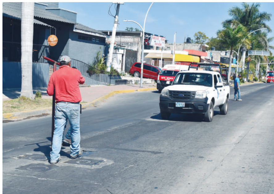
Los trabajadores del SIAPA tampoco dejan de laborar. En la foto reparando válvulas.

Hombre y mujeres trabajadores agremiados al SUTSEM, en sus tiempos libres realizan labores de limpieza de manera voluntaria en diferentes áreas de la ciudad.