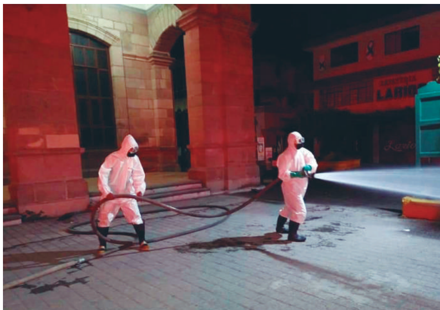
Los bomberos del Ayuntamiento de Tepic lavan la plaza principal en la ciudad de Tepic.