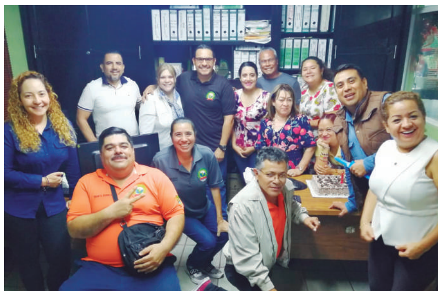
Ni la pandemia les quita el gusto de festejarse su cumpleaños con su respectivo pastelito.

Trabajadores del Gobierno del Estado cumpliendo con su trabajo en las tareas que se les encomienda así fueran de cumplidores los de Gobierno.