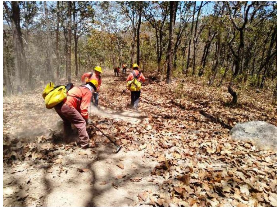
La Brigada de limpieza del Ayuntamiento desafiando el peligro del virus maldito, sin más protección que la de Dios, no dejan de cumplir con sus obligaciones aunque el patrón no cumpla con darles las bases que se las ganaron desde hace muchos años.