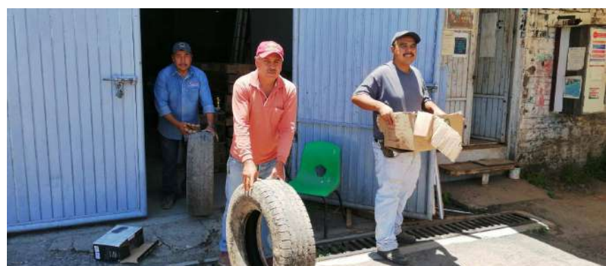
En el taller de mantenimiento de vehículos de SOP del Estado se continua trabajando como en tiempos normales, sin guantes, mascarillas ni cubre bocas.