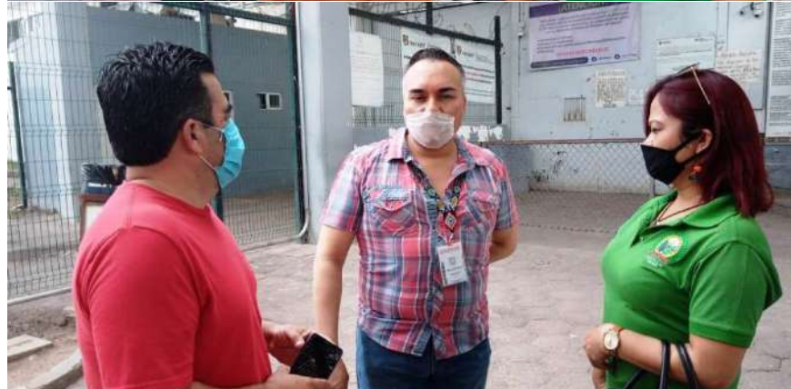
Integrantes del Comité del SUTSEM continúan visitando las áreas en donde se realizan guardias para verificar el cumplimiento de las normas de protección por parte de las autoridades hacia los trabajadores.