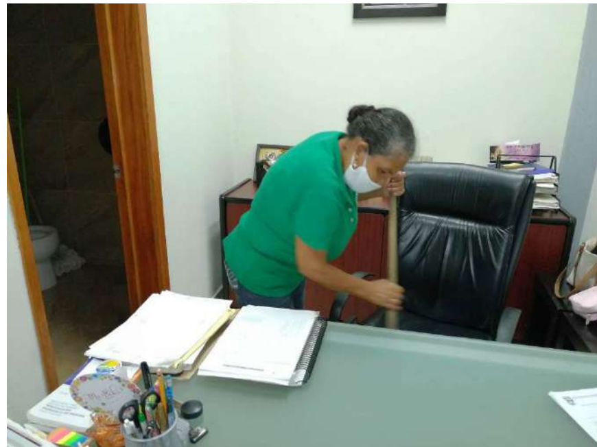
En la Comisión Estatal del Agua (CEA) laboran las guardias con la mejor de las medidas de seguridad.