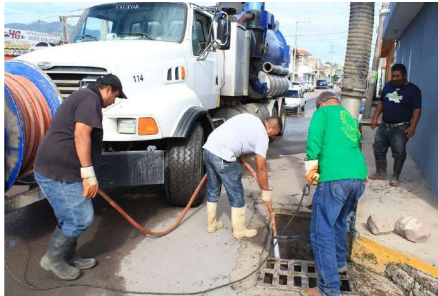
Los SUTSEMistas de Santiago Ixc. con la verde bien puesta.