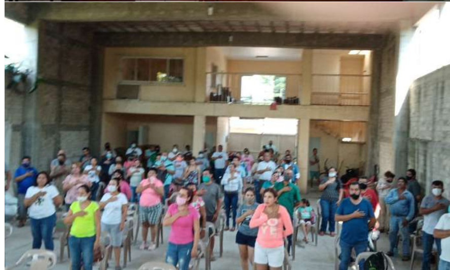
Los integrantes del Comité atienden permanentemente los asuntos de los trabajadores de las diferentes dependencias gubernamentales.