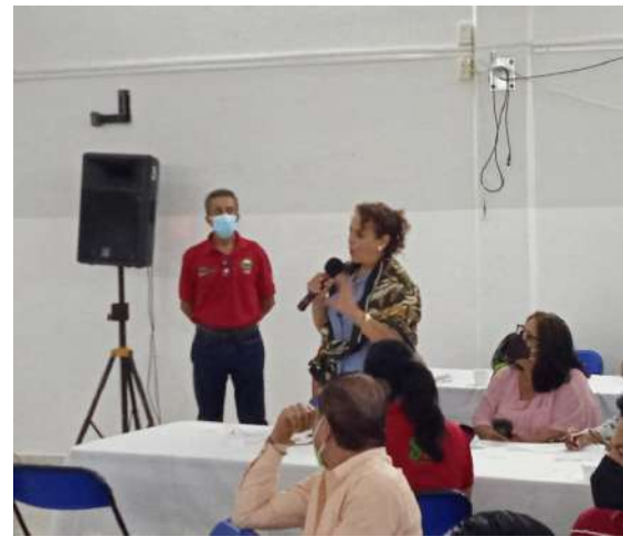
Los SUTSEMistas de la Sección de Huajicori siguen apoyando a quienes carecen hasta de lo indispensable para la subsistencia.