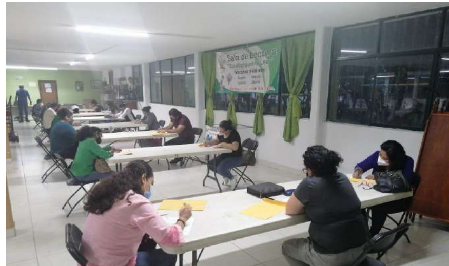
Aspirantes a ascensos escalafonarios del CECAN realizan exámenes de oposición para cubrir vacantes del SUTSEM.