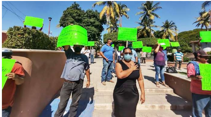
Los trabajadores que ya cubren los requisitos para obtener el beneficio de la jubilación, exigen el cumplimiento de las autoridades mediante amparo que los jurídicos del SUTSEM están elaborando.