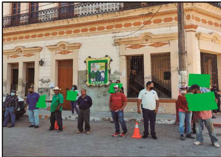
Plantón afuera de la Presidencia de Tuxpan

Plantones por la falta de pagos de prestaciones y aumento salarial. Estas protestas se llevarán a cabo gradualmente en las diferentes áreas y ayuntamientos