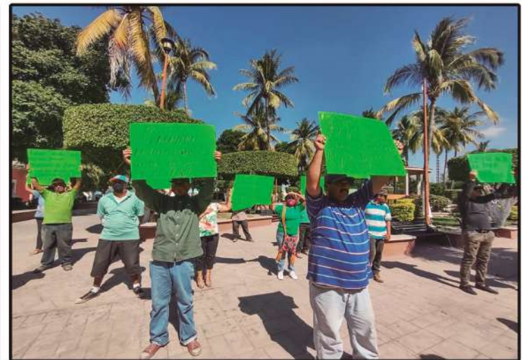
Frente a la plaza de la Presidencia de Tuxpan