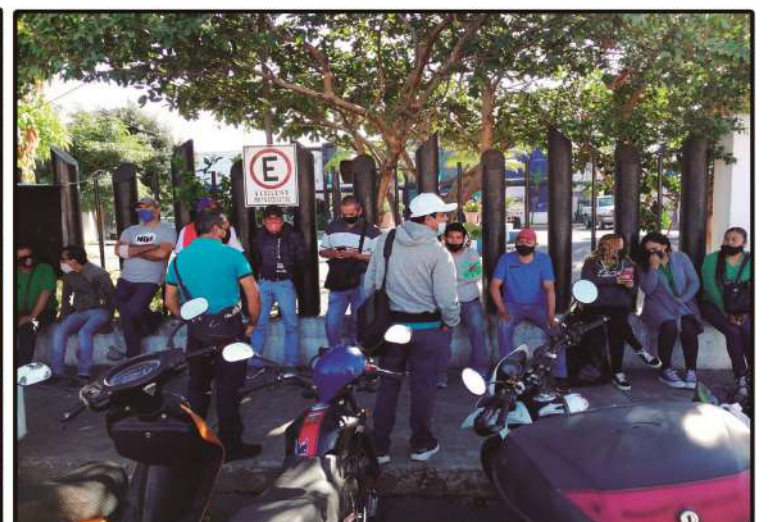
Manifestación por trabajadores del SIAPA Tepic