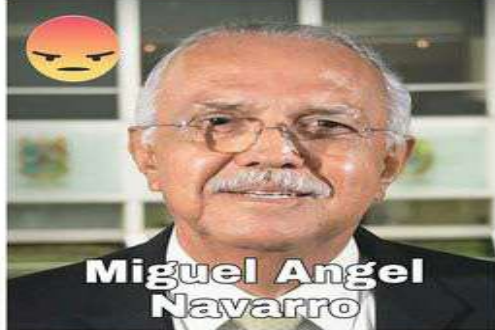
Miguel Ángel Navarro

Ya transcurrieron los días de incertidumbre en los partidos políticos sobre la selección de los aspirantes a la gubernatura de Nayarit, cobijados en coaliciones o fuera de ellas y con el firme respaldo de las directrices de sus institutos políticos para lograr los mejores y mayores resultados en las votaciones del 6 del junio del 2021. PAN, PRD y PRI, considerados con fundamentos doctrinarios diferentes y con estatutos Internos propios que marcan la fuerza organizativa, dejaron a un lado todo tipo de diferencias para unirse en esta etapa electoral e integrar una alianza que vaya por un mismo objetivo en bien de "nuestro estado y nuestro país" como lo dijera el presidente estatal del tricolor, Enrique Díaz, al ser registrada la coalición ante el Instituto Estatal Electoral de Nayarit. Otra alianza ya oficializada con el visto bueno del IEEN, es la formada por MORENA, VERDE ECOLOGISTA, PT y Nueva Alianza, llevando como único aspirante al gobierno del estado al doctor Miguel Ángel Navarro Quintero, quien al ser confirmado para ese cargo expreso "Es momento de consolidar la cuarta transformación en nuestra tierra, en equipo de la mano y firmes para que nadie se quede atrás; lograremos un Nayarit para todos".