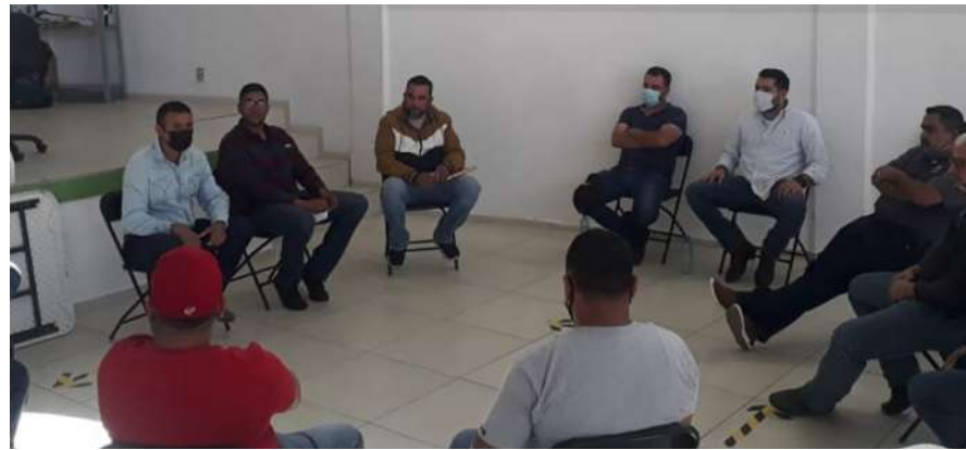
• Compañeros del Comité llevaron a cabo reunión de trabajo con trabajadores del Rastro Municipal.

• Los SUTSEMistas de la Sección de Compostela recibieron su Arcón Navideño.