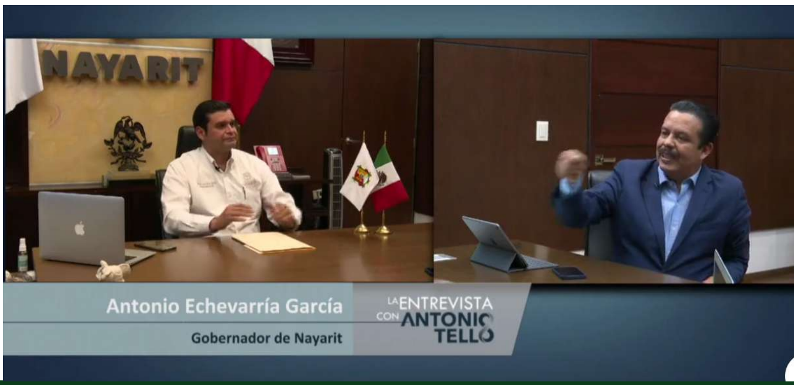
Antonio Echevarría García Gobernador de Nayarit

primera calidad en Puerta de Hierro en donde seguramente pagará mucho más que lo que debe pagar al ISSSTE por todos los trabajadores, que habría que ver si está pagando porque Toñito no sabe pagar las deudas. Toño, igual que el rata mayor Roberto, han sacrificado demasiado los trabajadores, pero hay un Dios justiciero y en su salud lo hallará y ahora Toño igual que el gorramiada pretenderán protegerse en el partido en el poder dándole todo su apoyo a Morena que no ha tenido escrúpulos de recibir a lo peorcito de los Robertistas y el apoyo económico del dinero que les quitan a los trabajadores por concepto de impuestos. Así las cosas para los trabajadores y ¡sigue la impunidad galopante señores! A ver hasta cuando el pueblo abrirá los ojos y que quede claro: ¡Toño no tiene de qué quejarse porque no paga las prestaciones! Y según él su gran logro es el haber impuesto la ley burocrática para explotar a la gente y hacer más rica a su familia. Esto para que los trabajadores los registren en su memoria