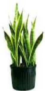
Lengua de suegra o de tigre (Sansevieria Trifasciata)