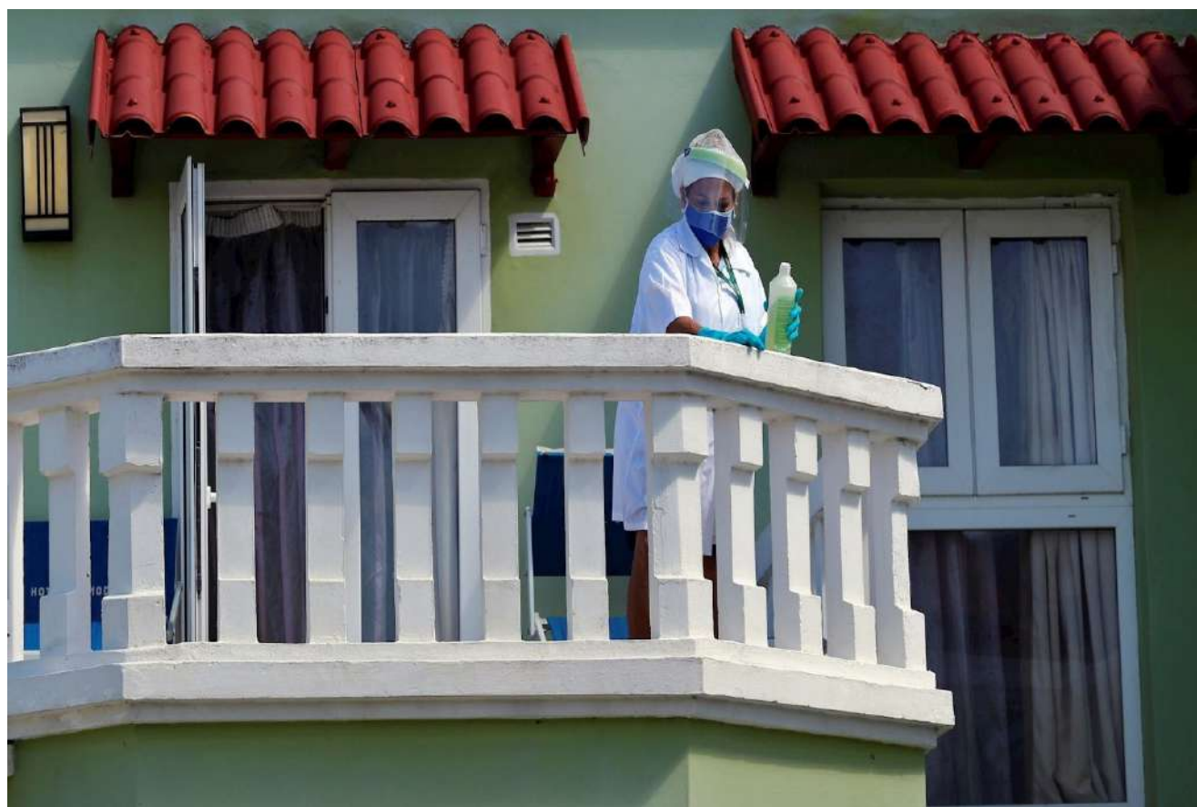
Foto: Una trabajadora del servicio de un hotel realiza labores de limpieza el 11 de febrero de 2021, en La Habana (Cuba).

"Siempre les digo a los clientes: ahora aquí quien manda en el hotel es la bata blanca, son los doctores, porque la prioridad es que nos cuidemos todos", afirma el director de este hotel, que reserva 90 habitaciones para viajeros en aislamiento de las cuales en este momento están ocupadas 22.