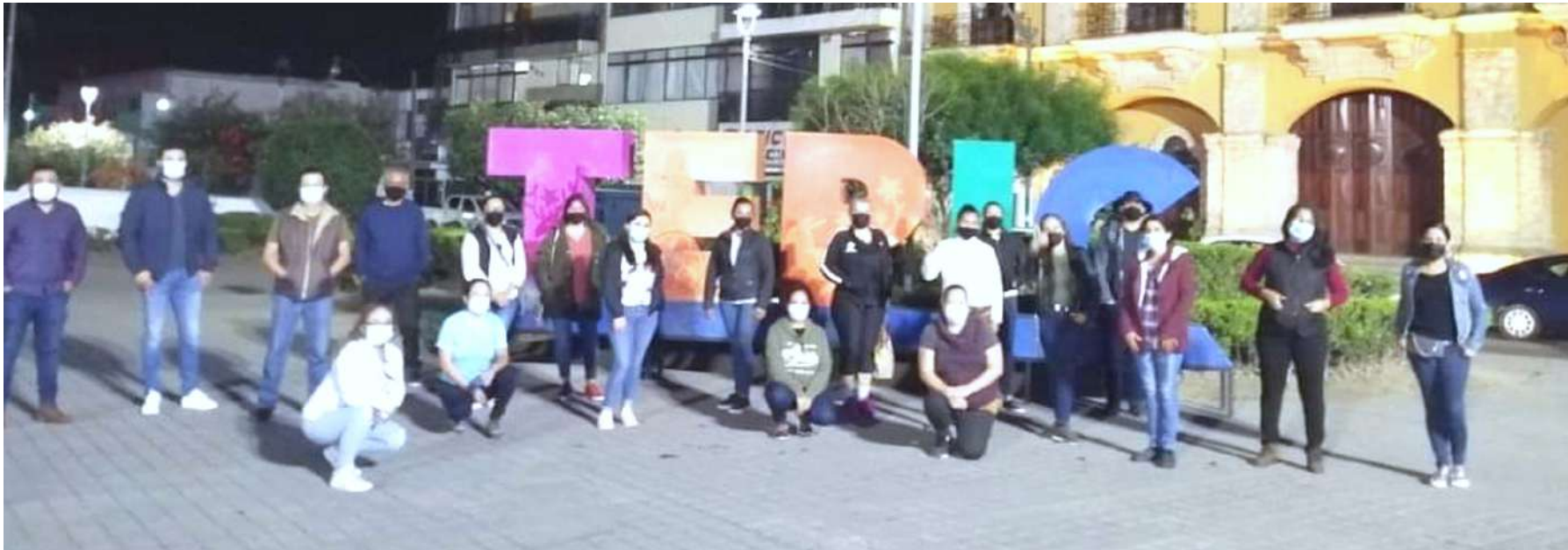
Los maestros huelguistas de la UAN mantienen limpias las instalaciones aseando mientras mantienen su plantón de protesta.