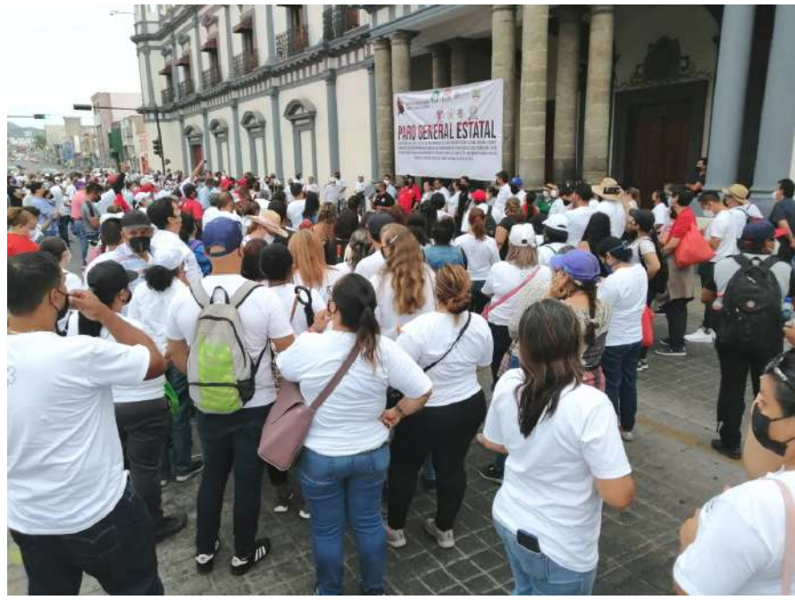
Trabajadores del CESAME también exigen atención de parte de Gobierno del Estado a su necesidad de ser protegidos del peligro del CIVID 19.