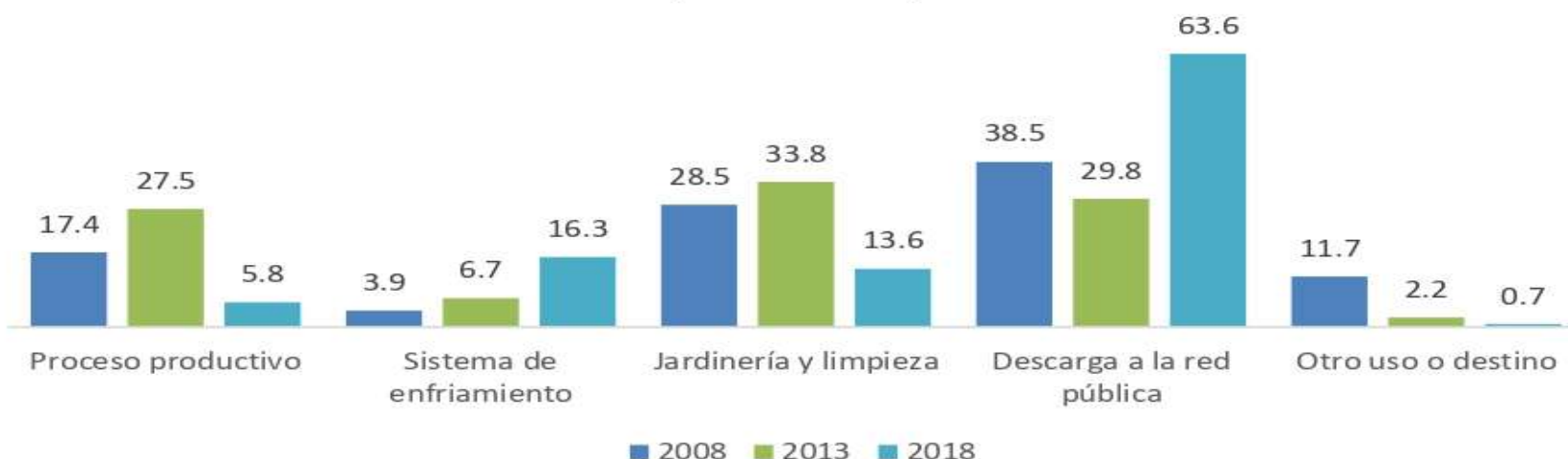
USO PRINCIPAL DE LAS AGUAS RESIDUALES EN LAS UNIDADES ECONÓMICAS GRANDES, 2008-2018 (PORCENTAJES)

COMUNICADO DE PRENSA NÚM. 333/21 3 DE JUNIO DE 2021 PÁGINA 3/5